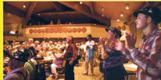
Gute Unterhaltung !