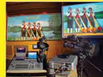
bis 14m 2 Videowand